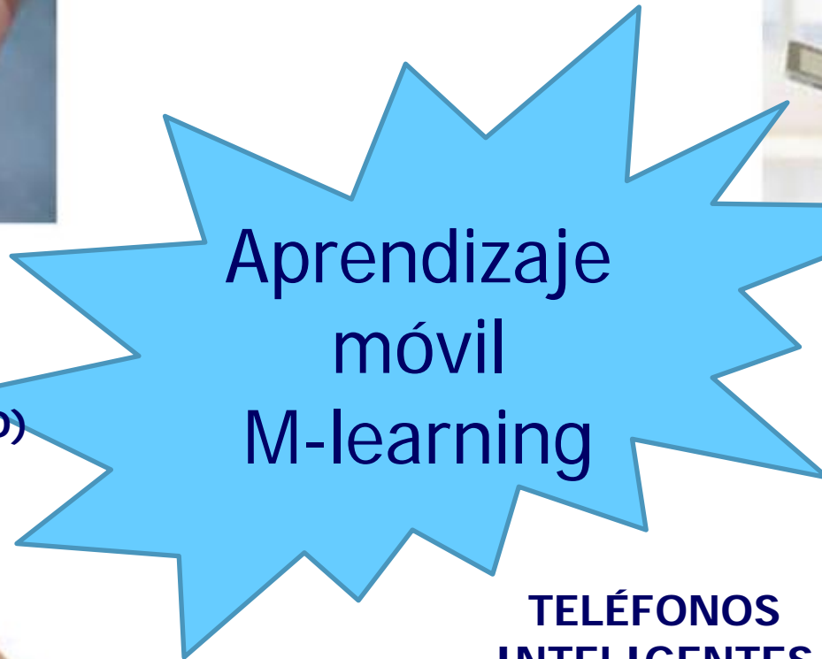
TELÉFONOS INTELIGENTES (SMARTPHONE)