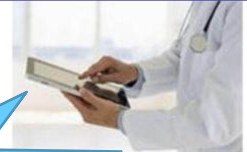
LECTOR DE LIBROS