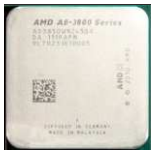
Figura 15. Microprocesador AMD® APU Vision A8 3800

En 2011 la firma AMD® lanza la familia de procesadores Vision E2 y A4, además de otros dos con tecnología APU (Accelerated Processing Unit) ó Unidades aceleradoras de procesamiento, integrada en los modelos A6 y A8 en contraofensiva del la gama iX de Intel® y su tecnología Sandy Bridge. Esta tecnología potencia la DNA del diseño de AMD® Radeon para tarjetas gráficas dedicadas en un PC de un único chip, para computadoras de bajo formato físico como Laptop y Desktop, básicamente la integración del Northbridge + el procesador multinúcleo + el procesador de gráficos ó GPU. Da clik aqui para ver la imagen que provee AMD sobre su tecnología.