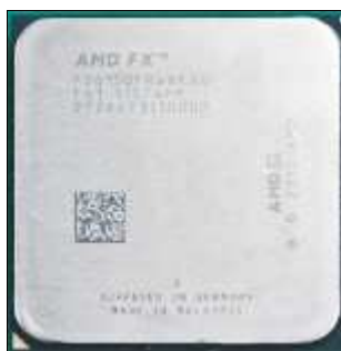
Figura 16. Microprocesador AMD® FX 8150

En 2012 la firma AMD® lanza la familia de procesadores FX, anteriormente tecnología reservada para servidores, ahora comercialmente para equipos de sobremesa a 64 bits, compatible de manera con arquitectura de 32 bits, con tecnología HT (HyperTransport) que reduce cuellos de botella. La nomenclatura 4XYZ, 6XYZ y 8XYZ, indica en el primer dígito el número de núcleos con que cuenta el procesador.