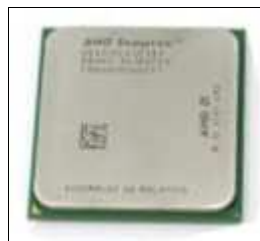
Figura 9. Microprocesador AMD® Sempron

+ Athlon 64: siguiendo la tendencia, maneja Prestaciones Relativas de 3000+ hasta 3800+ (esto en la práctica es mejor considerarlo como un modelo mas que velocidades), se coloca en el Socket 940 AM2, tiene un bus de 1600 MHz, memoria L2=640 KB y 1 MB.