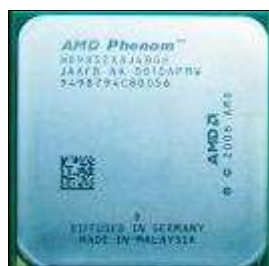
Figura 11. Microprocesador AMD® Phenom

En 2008, AMD® cuenta con una nueva gama de procesadores que reemplaza la familia Athlon denominada Phenom, basadas en triple y cuádruple núcleo. Es importante mencionar que regresan a la nomenclatura de utilizar los GHz y así ser reconocida su velocidad. Se describen a continuación las características de cada familia: