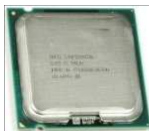
Figura 10. Microprocesador Intel® Core2Quad

+ Core2Duo: en 2008 Intel® abandona la nomenclatura de Pentium y lanza una nueva gama de productos denominados Core2Duo, lo que significa doble núcleo. Esto significa que en su interior, este contiene 2 procesadores trabajando de manera simultánea y repartíendose las actividades, trabajando de manera mas eficiente. Las velocidades alcanzadas son 2.0 GHz - 3.0 GHz, con un bus de 800 - 1066 - 1333 MHz, cache de 2 MB - 3 MB - 4 MB - 6 MB y utilizado por el Socket 775.