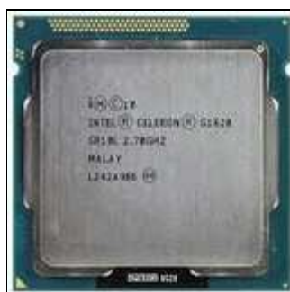
Figura 14. Microprocesador Intel® Celeron G1620

Mientras en el mercado comercial Intel® lanza nuevos y potentes modelos de procesadores tales como las familias iX, estos vienen acompañados de versiones de baja gama, es decir, que cuentan con menores prestaciones relativas, como el caso del los modelos austeros Celeron, los cuáles se encuentran diseñados con menor cantidad de memoria Caché, sin embargo las frecuencias y el aumento de núcleos son algo que no los limita, ya que los hay de 2 núcleos y frecuencias de hasta 2.7 GHz, básicamente utilizando el Slot LGA 1150 y 1155.