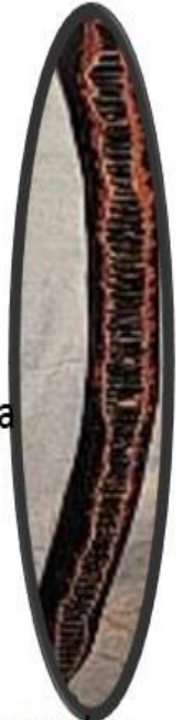
cañandonga Pino macho