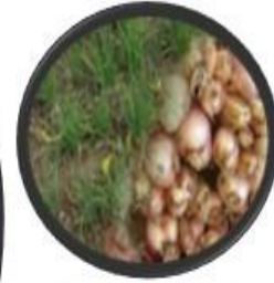
Protectora de los pequeños vasos Cebolla