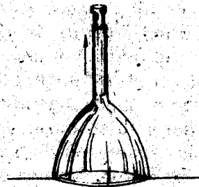
Fig. 6.3 Ventosa.

Existen ventosas con fuego y con bomba de succión (fig. 6.3).