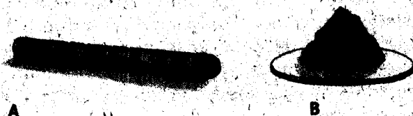
Fig. 6.2 Tipos de moxas: A, tabaco; B, picadura de artemisa.

La moxibustión es un método de tratamiento en la Medicina Tradicional Asiática con el cual se previene o se trata la enfermedad mediante la quemadura que se produce con picadura de artemisa (moxa) en el punto de acupuntura (fig. 6.2).