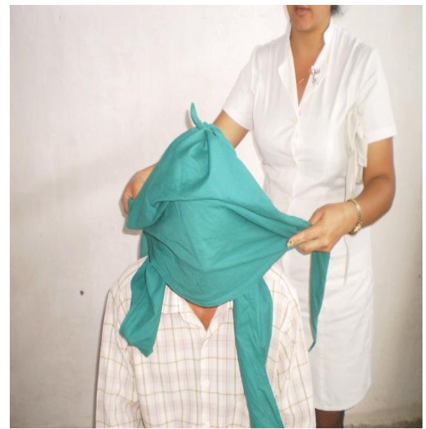
Total de la cabeza