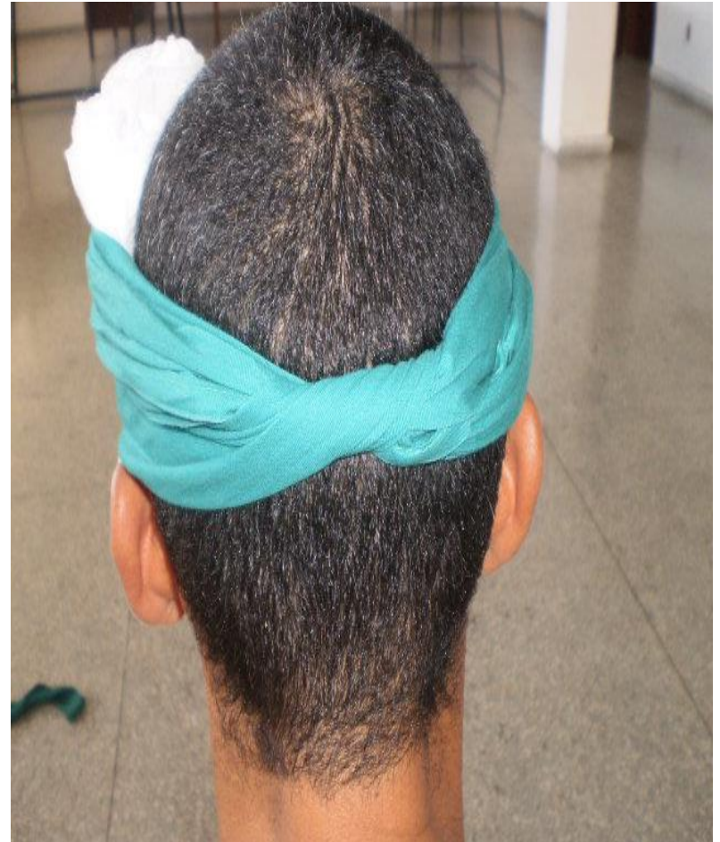
Circular de la cabeza