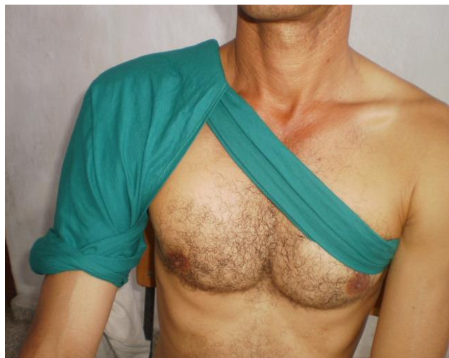
Combinado del hombro