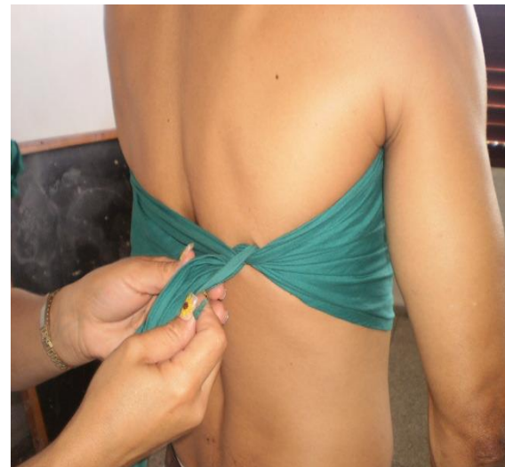
Ancho del tórax