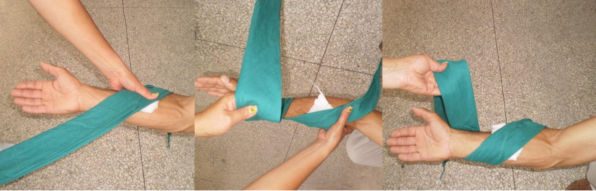
Circular de los miembros