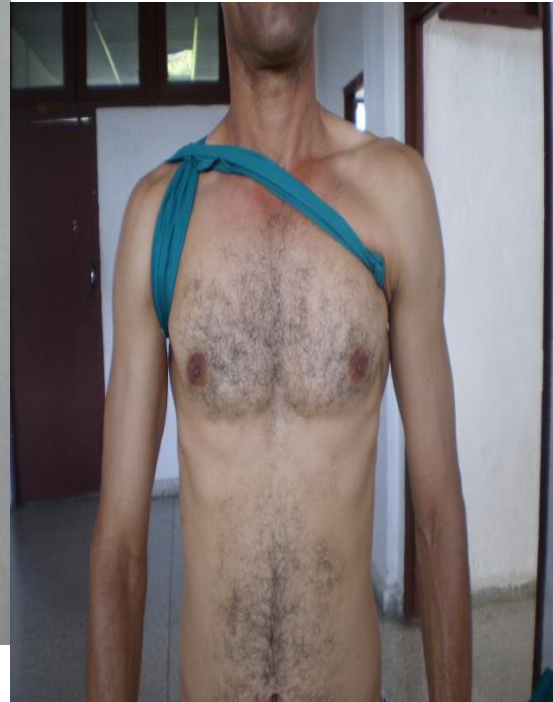
En ocho de la axila