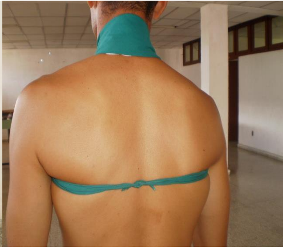
En ocho de la nuca