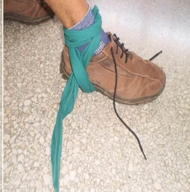
Inmovilizador del tobillo