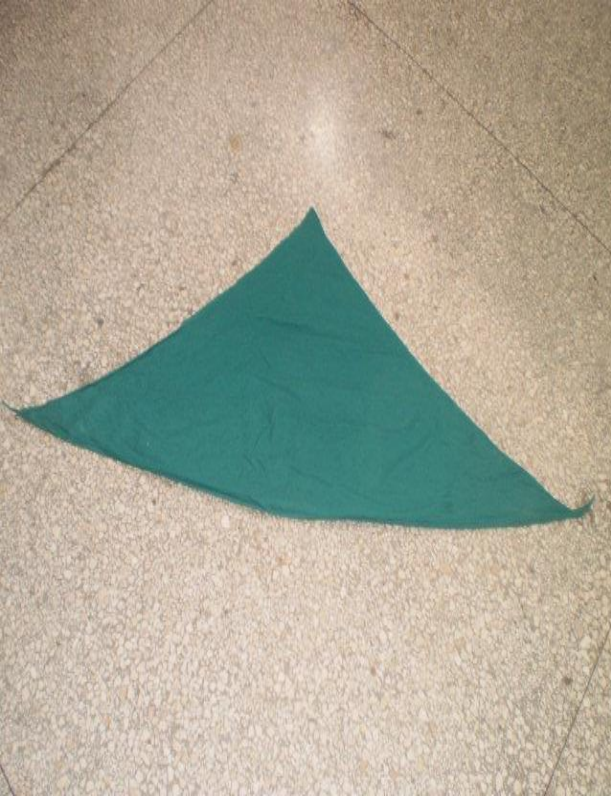
Triangular, ancho o total