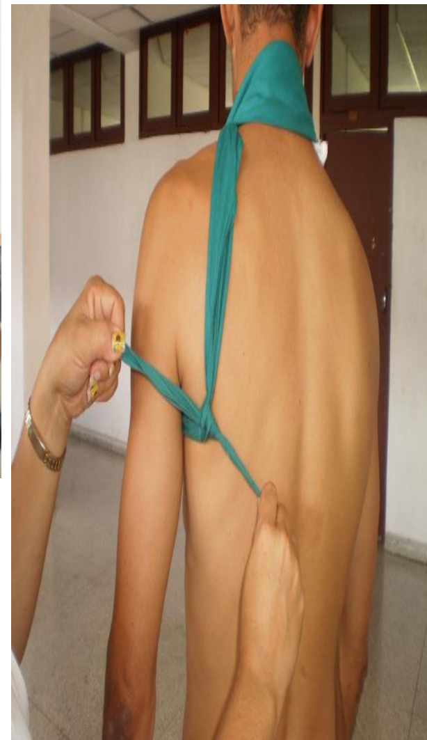
En ocho del cuello