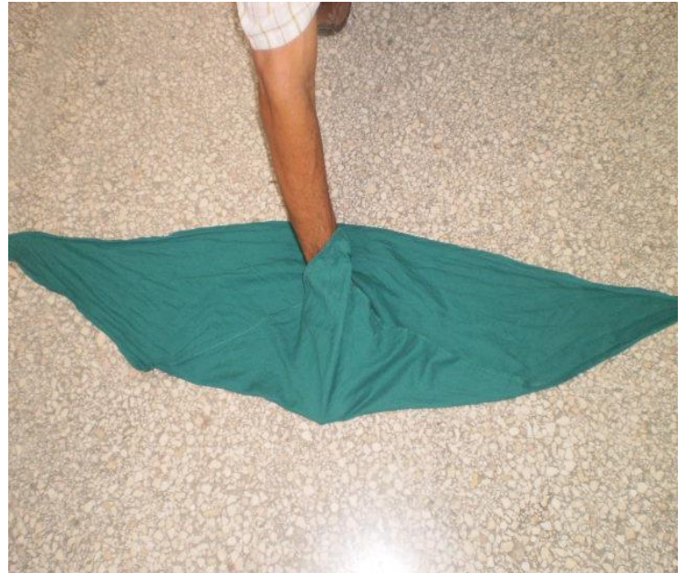
Ancho de la mano