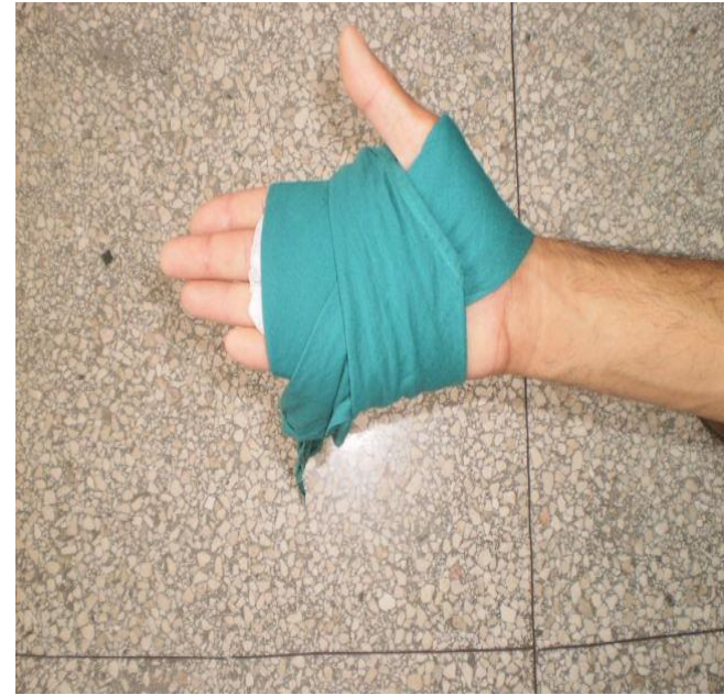
En ocho de la mano