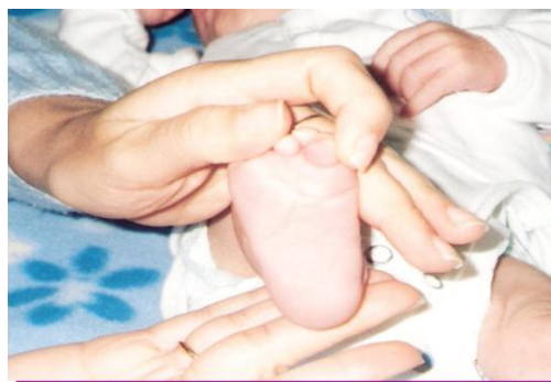
Figura 2. Se observan los pliegues profundos en los pies.