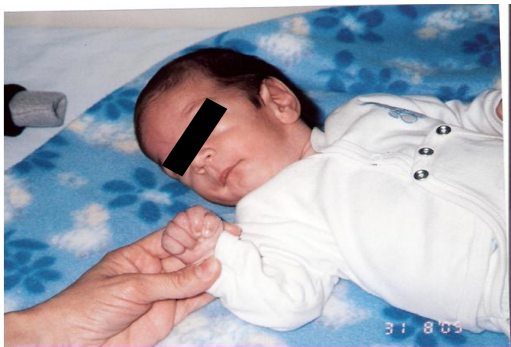
Figura 1. Se observa en el paciente dolicocefalia, microretrognatia, pabellón auricular prominente, puente nasal alto, filtro largo y cuello corto.

Paciente de sexo masculino, de 3 meses de vida, madre y padre de 30 años de edad, no consanguíneos, con antecedente de un aborto espontáneo de causa desconocida, no hay antecedentes patológicos del embarazo actual, ni de ingestión de medicamentos. Si presentó placenta de inserción baja, con hemorragias leves durante el tercer y cuarto mes. Al examen físico el niño presentó el siguiente fenotipo: circunferencia cefálica 39,5 cm percentilo 25; talla 57 cm. percentilo 10; peso 3,5 Kg, dolicocefalia, puente nasal alto, orejas de implantación baja, microretrognatia, fontanela anterior amplia, pliegues palmares únicos en manos y profundos en pies (Figuras 1 y 2) y soplo cardíaco; por ecocardiografía se detectó la Tetralogía de Fallot.