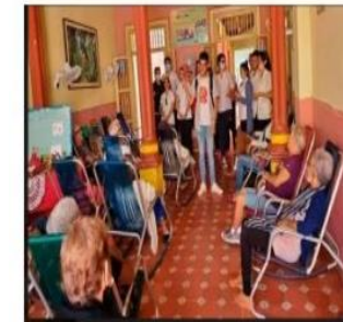
Visita de jóvenes de las ciencias médicas a hogares de ancianos y casa de abuelos en Holguín

11 abril 2024 | 134 | 0 | Fuente: informed Holguín