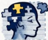
Psicosis / Encefalopatía