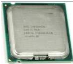
Microprocesador Intel® Core2Quad

+ Core2Duo: en 2008 Intel® abandona la nomenclatura de Pentium y lanza una nueva gama de productos denominados Core2Duo, lo que significa doble núcleo. Esto significa que en su interior, este contiene 2 procesadores trabajando de manera simultánea y repartiéndose las actividades, trabajando de manera mas eficiente. Las velocidades alcanzadas son 2.0 GHz - 3.0 GHz, con un bus de 800 - 1066 - 1333 MHz, cache de 2 MB - 3 MB - 4 MB - 6 MB y utilizado por el Socket 775.