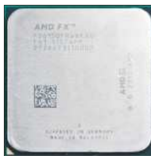
Microprocesador AMD® FX 8150

En 2012 la firma AMD® lanza la familia de procesadores FX, anteriormente tecnología reservada para servidores, ahora comercialmente para equipos de sobremesa a 64 bits, compatible de manera con arquitectura de 32 bits, con tecnología HT (HyperTransport) que reduce cuellos de botella. La nomenclatura 4XYZ, 6XYZ y 8XYZ, indica en el primer dígito el número de núcleos con que cuenta el procesador.