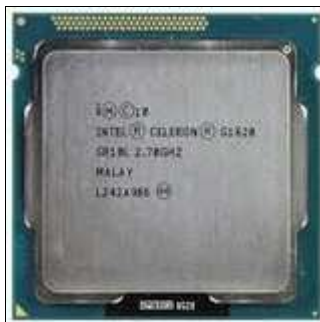
Microprocesador Intel® Celeron G1620

Mientras en el mercado comercial Intel® lanza nuevos y potentes modelos de procesadores tales como las familias iX, estos vienen acompañados de versiones de baja gama, es decir, que cuentan con menores prestaciones relativas, como el caso del los modelos austeros Celeron, los cuáles se encuentran diseñados con menor cantidad de memoria Caché, sin embargo las frecuencias y el aumento de núcleos son algo que no los limita, ya que los hay de 2 núcleos y frecuencias de hasta 2.7 GHz, básicamente utilizando el Slot LGA 1150 y 1155.