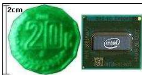
Microprocesador Intel® Atom y su tamaño comparativo

En 2008 la firma Intel® lanza la familia de procesadores de bajo consumo de energía y diseñados para dispositivos móviles con acceso a Internet, los cuáles conservan compatibilidad con las instrucciones del Intel® Core2Duo; contienen en su interior 47 millones de transistores los cuáles son los mas diminutos del mercado y alcanzan velocidades de hasta 1.8 GHz e inclusive algunos modelos cuentan con doble núcleo.