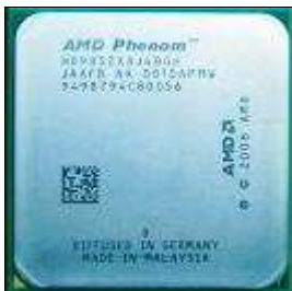
Microprocesador AMD® Phenom

En 2008, AMD® cuenta con una nueva gama de procesadores que reemplaza la familia Athlon denominada Phenom, basadas en triple y cuádruple núcleo. Es importante mencionar que regresan a la nomenclatura de utilizar los GHz y así ser reconocida su velocidad. Se describen a continuación las características de cada familia: