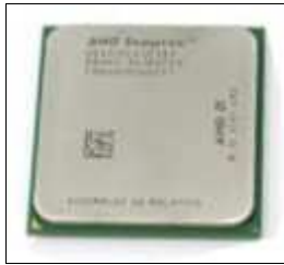
Microprocesador AMD® Sempron

+ Athlon 64: siguiendo la tendencia, maneja Prestaciones Relativas de 3000+ hasta 3800+ (esto en la práctica es mejor considerarlo como un modelo mas que velocidades), se coloca en el Socket 940 AM2, tiene un bus de 1600 MHz, memoria L2=640 KB y 1 MB.