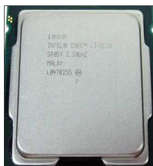
Microprocesador Intel® i3 2120, 3.30 GHz

Es la nueva gama de procesadores de la firma Intel®, con la nomenclatura Core iX, dónde el valor de la X determina el nivel de capacidad que tiene el microprocesador (Core i3, Core i5, Core i7 y Core i9), esta nomenclatura puede tener dos razones de ser: primero a la tendencia retro hacia la antigua gama de procesadores Intel® como el i286, i386, etc. ó por la tendencia moderna de utilizar el prefijo "i" como lo hace la marca Apple® en sus iPod®.