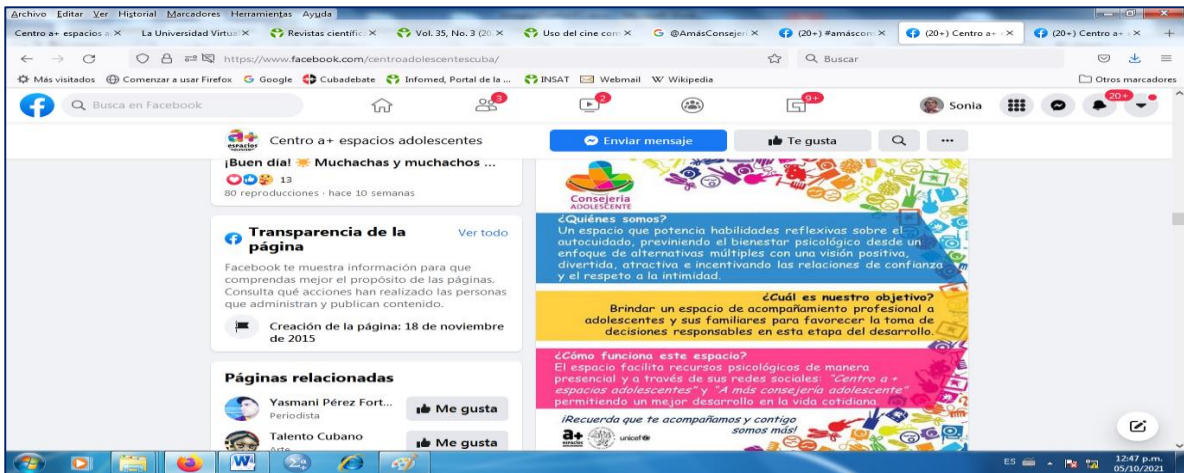
Servicio Consejería adolescente