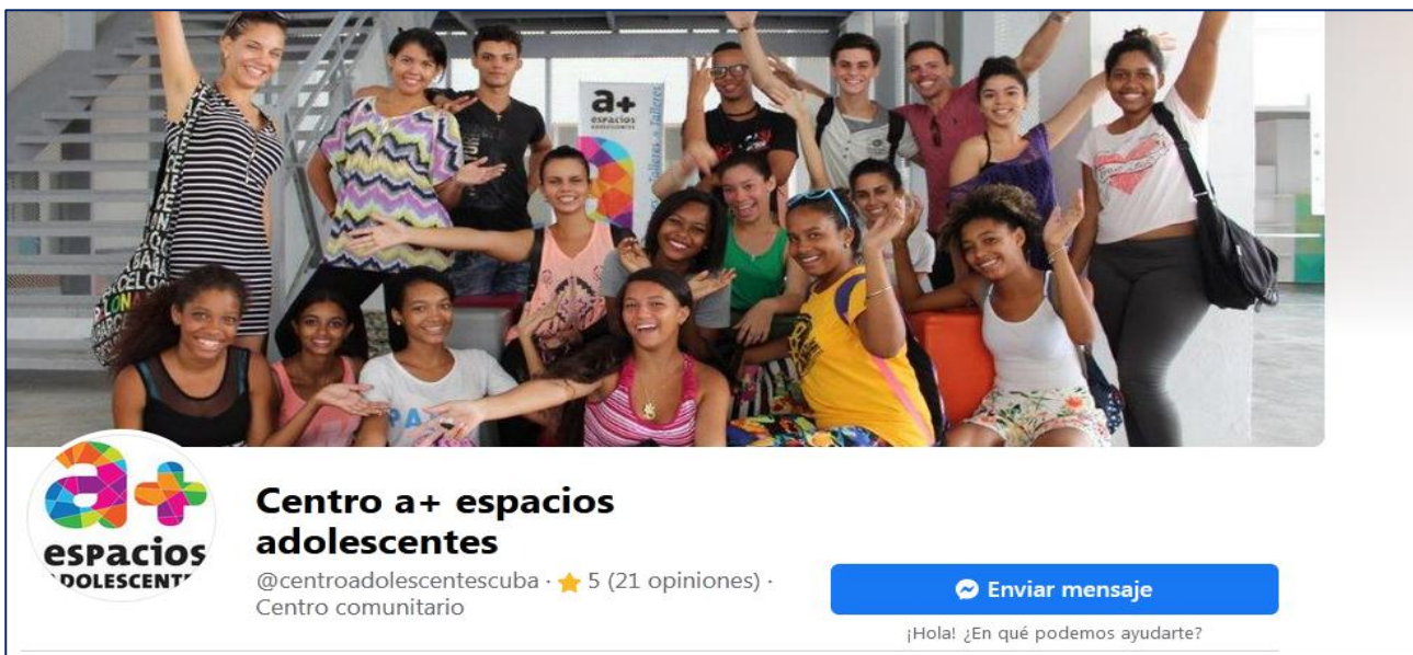
Perfil Facebook del Centro @centroadolescentescuba

Los contenidos que se han propuesto desde su creación hasta la actualidad avalan el encargo realizado por el grupo coordinador del perfil institucional en Facebook del Centro a+ espacios adolescentes. Estos contenidos logran un resultado y por ello una interpretación a la comunicación que se establece y un aprendizaje de esta, entre ellos se encuentran los concursos, los talleres de creación y el servicio de consejería adolescente.