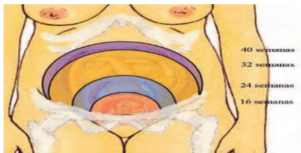
Figura 1. Esquema de la altura uterina durante la gestación