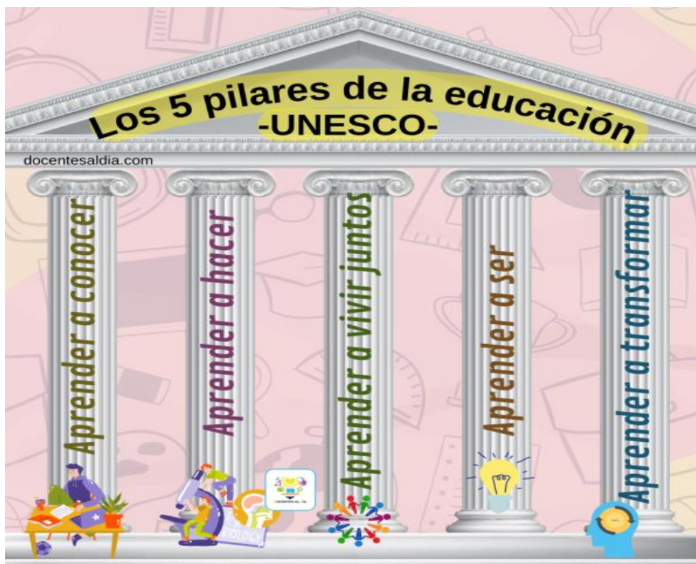
Fig. 2. Pilares que conforman la educación

Inicialmente se contaba con los 4 pilares de la educación , actualmente se cuenta con 5 pilares que son la base para aprender a aprender, desde el desarrollo del pensamiento crítico hasta la transición a nuevos conocimientos con un óptimo proceso de enseñanza – aprendizaje. (6)