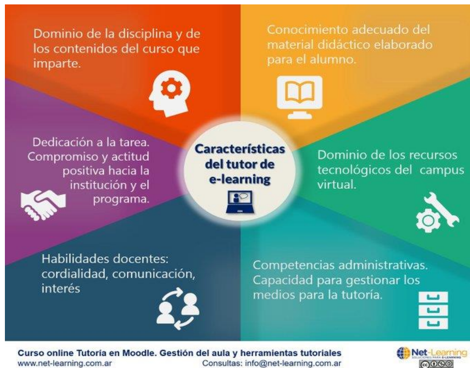
Fig.3. Características del docente virtual.