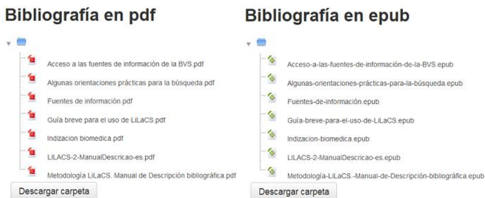
Figura 2. Bibliografías del curso en los formatos pd y epub

En la Figura 3 vemos la posibilidad de consultar la encuesta precurso en los formatos de pdf y de epub. Lo mismo sucede con la encuesta postcurso.