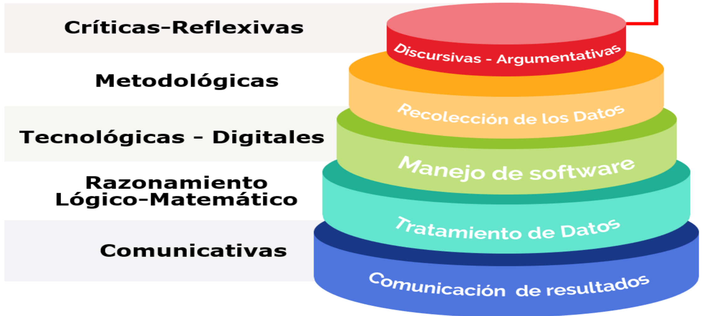
Gráfico 1: Taxonomía de las Competencias investigativas