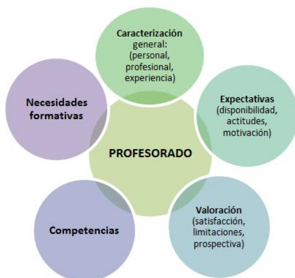
Figura 1. Esquema de codificación de los datos cualitativos

Se ha configurado el siguiente esquema de codificación: